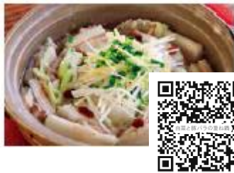
●中華風白菜と豚バラ肉の重ね鍋