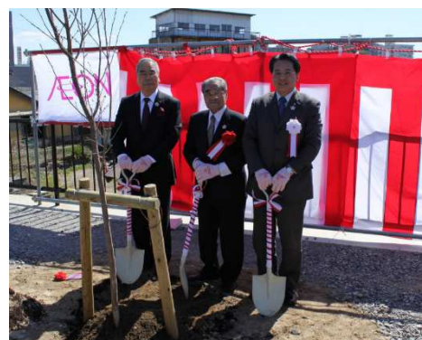
乙川堤防沿い記念植樹

また、1965年にイオンと同市とで植樹を行った乙川堤防沿いにて岡崎市長にもご参加いただき、記念植樹を行いました。