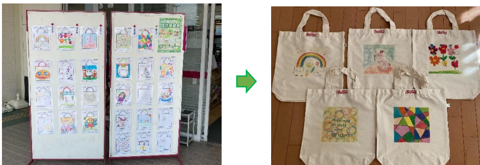
※昨年実施の「あったらいいな！世界にひとつだけのマイバッグ」店頭掲示の様子及び受賞者デザインのマイバッグ