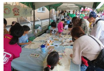
※マイバックづくりの様子