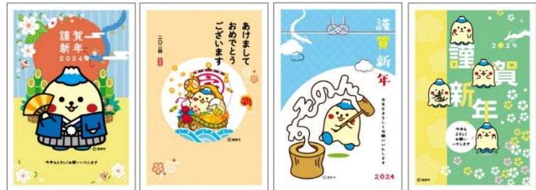
⑤ すそのん (裾野市)