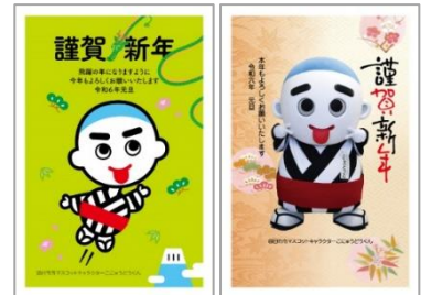
② こにゆうどうくん (四日市市)