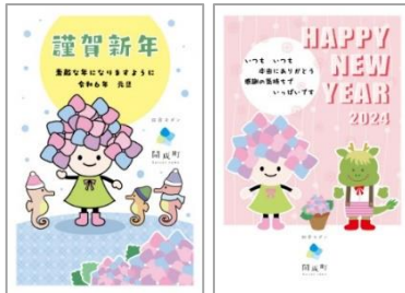
④ あじさいちゃん (開成町)