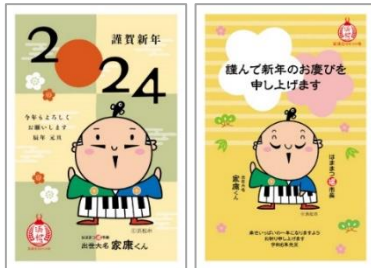
① 家康くん (浜松市)