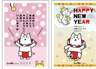
③ しっぺい (磐田市)