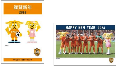
① 2024年版清水エスパルス