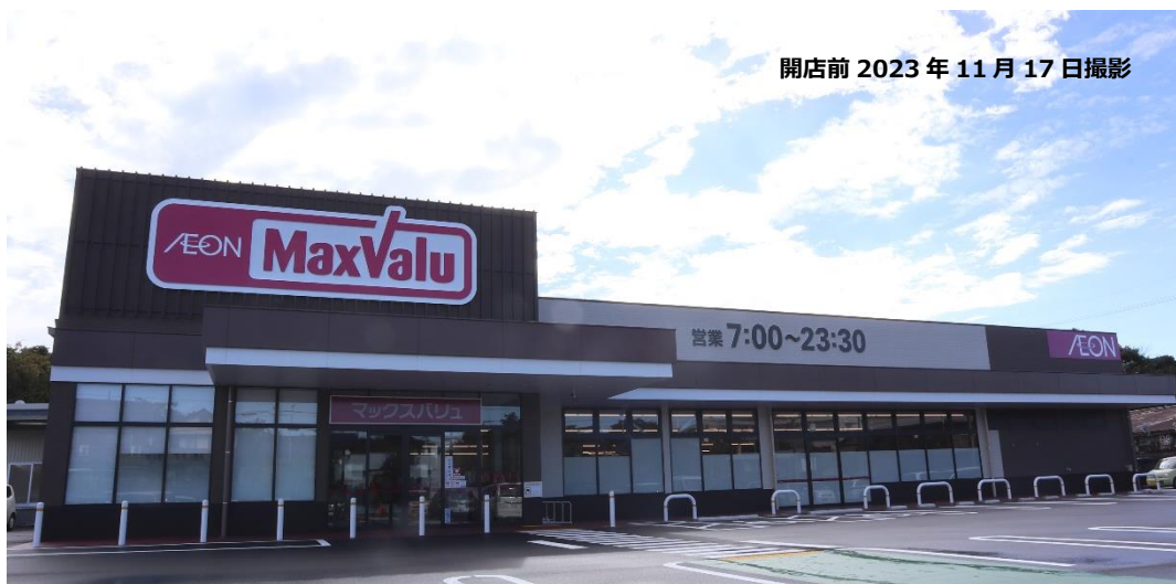
開店前 2023年11月17日撮影

マックスバリュ東海株式会社（本社：静岡県浜松市東区／代表取締役社長：作道 政昭）は、11月25日（土）、マックスバリュ志摩和具店を開店いたしますので、ご案内申し上げます。