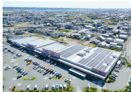
マックスバリュ浜北中瀬店