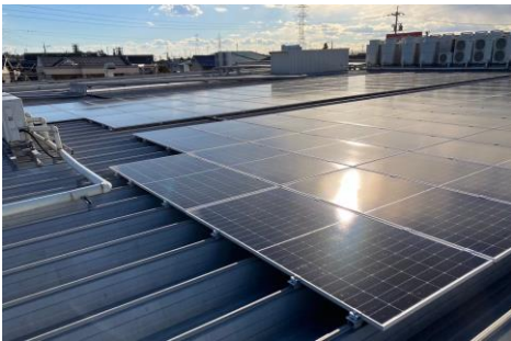
マックスバリュ津島江西店