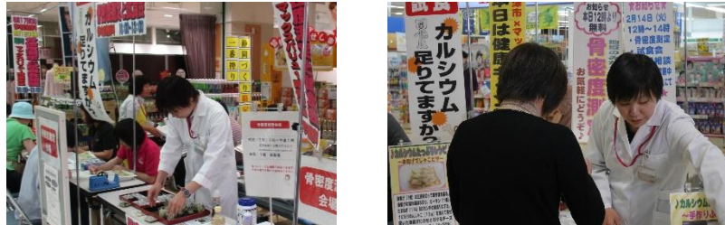
※（参考）過去開催時の様子

「健康キャンペーン」は、お買物に合わせて、お客さまご自身の健康について意識を高めさせていただくために取り組んでいる活動です。地域のお客さまの健康保持・増進を目的として、各自治体にご協力いただき、開催しています。